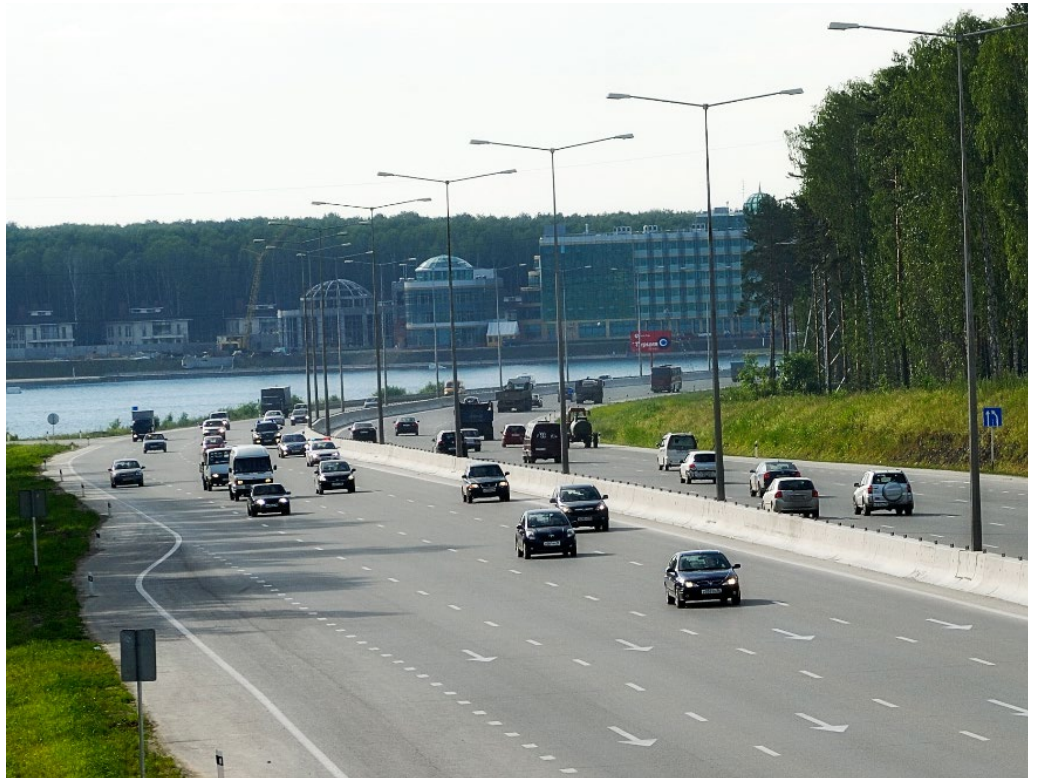
Объект автомобильная дорога Екатеринбург — аэропорт «Кольцово».